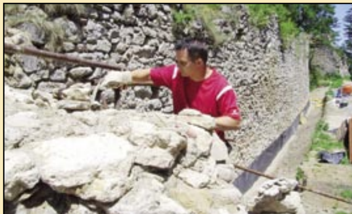
Takto prebiehali práce na obnove Hanigovského hradu.

V združení sa aktivizujú skúsení odborníci, napríklad z odboru archeológie, architektúry, geodézie, právnej oblasti a tiež členovia samosprávy dotknutých obcí a to všetko na dobrovoľníckej báze. Úzko spolupracujeme s najväčšími slovenskými združeniami, ktoré majú podobný charakter zamerania, napríklad Združením na záchranu Lietavského hradu, alebo združením Rákociho cesta z blízkeho Šarišského hradu. V súčasnosti sa podieľa združenie na konzervácii a na rekonštrukčných prácach na Hanigovskom hrade, kde sme už pripravili všetky potrebné podklady a kroky, ktoré musia predchádzať prácam na záchrane pamiatky v roku 2011. Vyzdvihnúť musíme prístup miestnej samosprávy, ktorej leží na srdci zachovanie kultúrneho dedičstva a to aj napriek problémom, ktoré naše samosprávy sužujú. Na svoju činnosť získavame financie v prvom rade