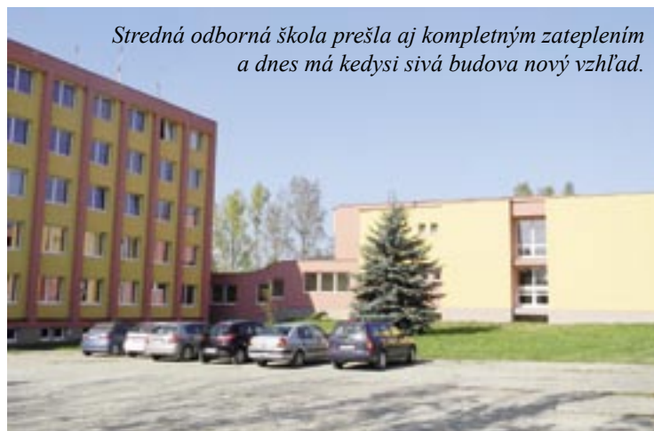
Stredná odborná škola prešla aj kompletným zateplením a dnes má kedysi sivá budova nový vzhľad.